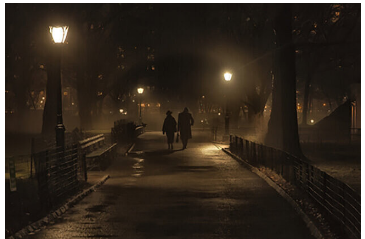
Sans amélioration de l'image