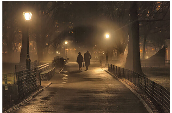
Avec amélioration de l'image

Le traitement de l'image est basé sur la théorie Retinex, dans laquelle les pixels sont optimisés individuellement.